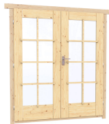
1.62×1.885 м. 1 шт.

7. Наличники: сухая строганная доска 20×100 мм.;