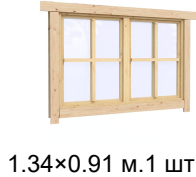
1.34×0.91 м.1 шт.