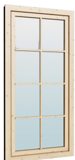
0.84×1.885 м.2 шт.