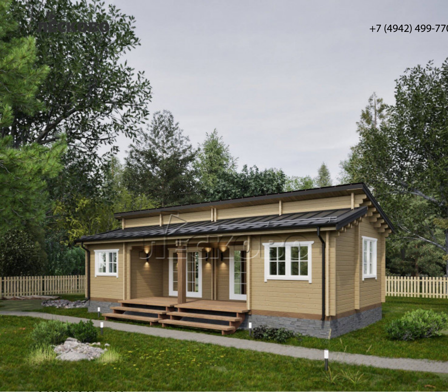
ДОМ ДИ 07